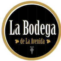
RESTAURANTE LA BODEGA DE LA AVENIDA